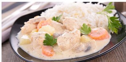
Blanquette de veau

Reprise de l'atelier cuisine le vendredi 12 janvier avec les référentes : P Plazanet, B Treut, M.O Jaubert